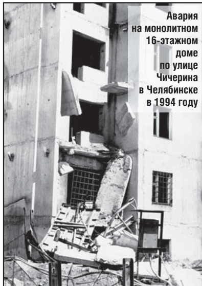
Авария на монолитном 16-этажном доме по улице Чичерина в Челябинске в 1994 году

(по материалам Государственной инспекции труда в Челябинской области) (Продолжение в следующем номере)